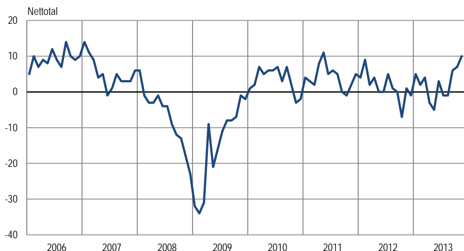
Sammensat konjunkturindikator for industri, sæsonkorrigeret

Anm.: Den sammensatte konjunkturindikator er en sammenvejning af forventet produktion, vurderet ordrebeholdning og vurderede færdigvarelagre.