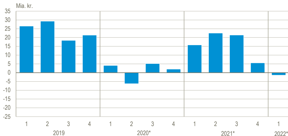
Figur 2. Den offentlige saldo (fordringserhvervelsen, netto)